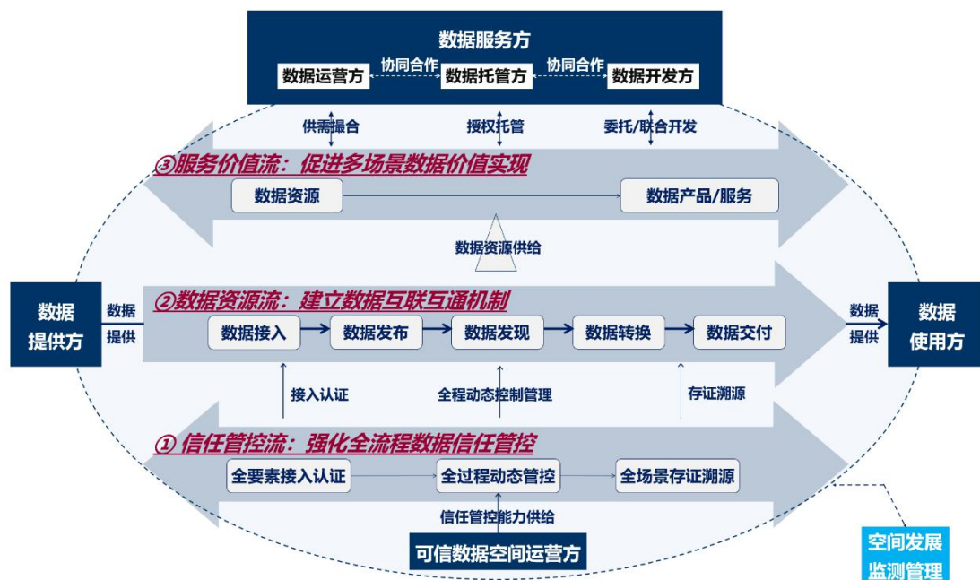
图 2 可信数据空间架构图

可信数据空间是基于共识规则，联接多方主体，实现数据资源共享共用的一种数据流通利用设施，是数据要素价值共创的应用生态，是支撑构建全国一体化数据市场的重要载体。可信数据空间须具备数据可信管控、资源交互、价值共创三类核心能力。